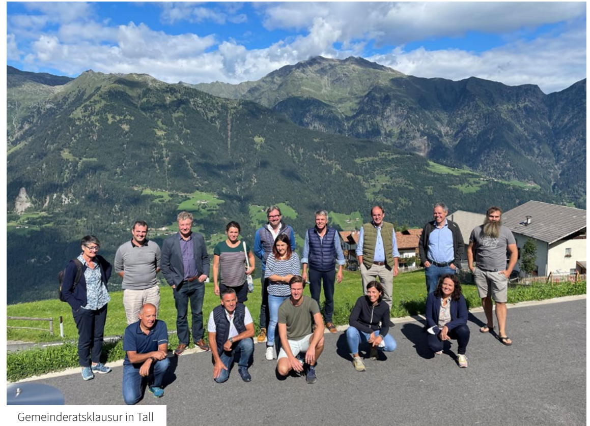
Gemeinderatsklausur in Tall