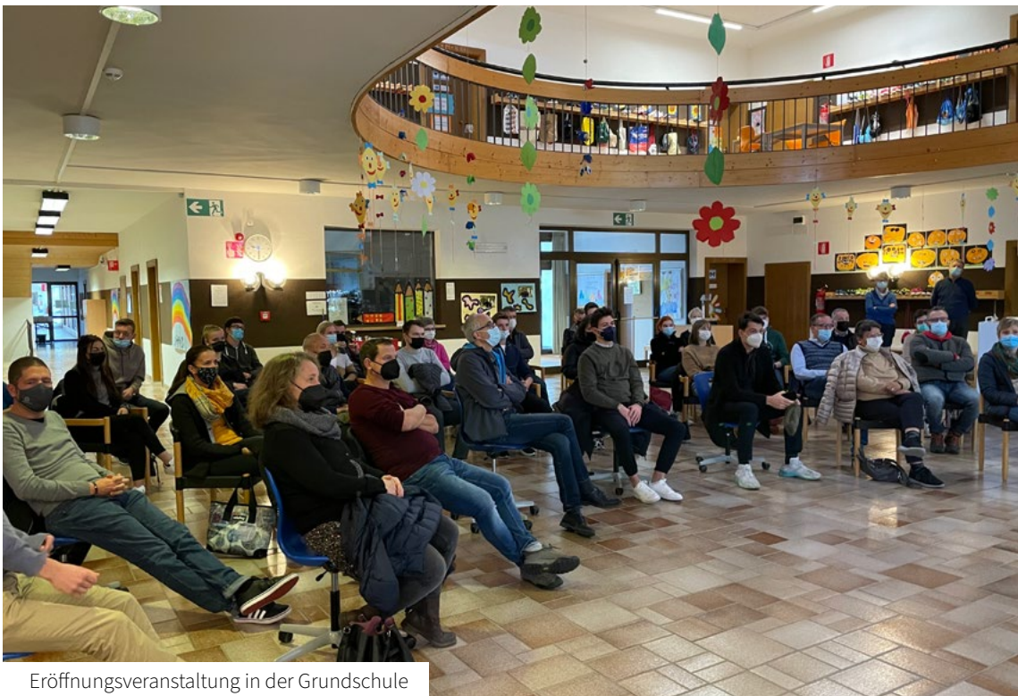
Eröffnungsveranstaltung in der Grundschule